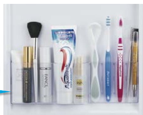
TW-T55L (LEDタイプ) 使用例